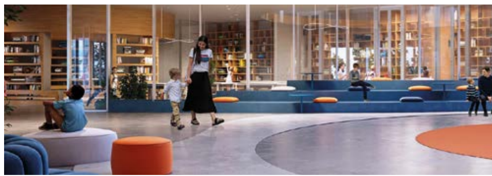
Un render degli interni

Dal gennaio 2025, gli allievi di San Chiaffredo si trasferiscono nel capoluogo, nella ex sede della scuola primaria, per permettere i lavori di ricostruzione.