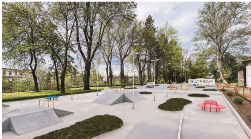
Il progetto dello skate park

Sono ispirate principalmente dalla volontà di rinnovare i luoghi di aggregazione dedicati alle diverse fasce di età