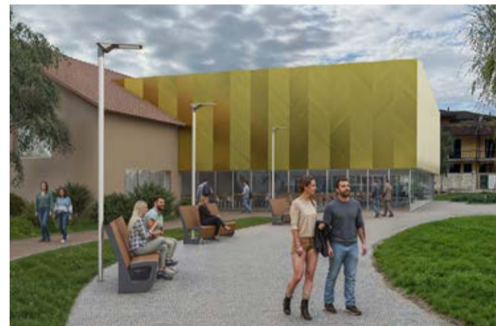
Il nuovo Salone polivalente