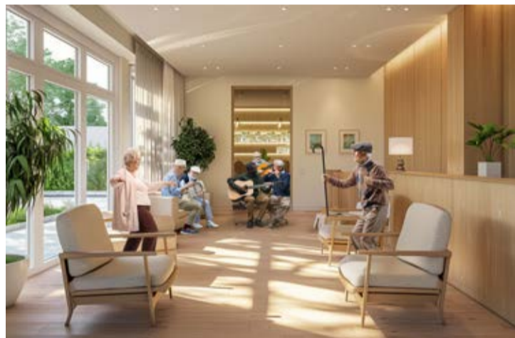
Riqualificazione della casa di riposo

Un'opera fondamentale è la ristrutturazione e la riqualificazione della casa di riposo Santissima Annunziata, alla qual si vogliono dare nuovi ambienti più luminosi e moderni per migliorare l'accessibilità, il comfort e la sicurezza. Attraverso l'aggiornamento delle infrastrutture, l'inserimento di tecnologie assistive e la creazione di spazi accoglienti e funzionali, si vogliono promuovere il benessere e la qualità della vita degli anziani.