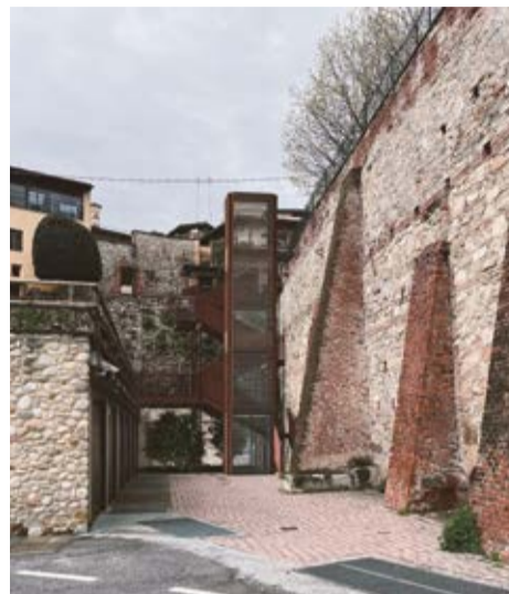
L'ascensore per piazza Diaz

Dopo la creazione dello Spazio Incontri Porta Santa Maria, si pensa alla realizzazione