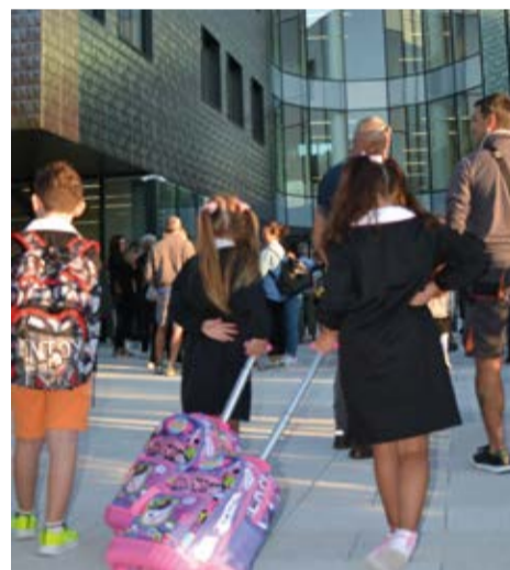
Il primo giorno

Inoltre, sono state organizzate visite guidate per i cittadini desiderosi di vedere dall'interno per questa nuova struttura, che, in effetti, è stata studiata per essere a disposizione di tutta la città, con il suo auditorium, la palestra e gli spazi esterni in via di ultimazione.